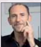
Andreas Winter www.andreaswinter.de