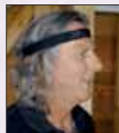
Reinhard Stengel www.reinhard-stengel.de