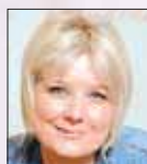
Melanie Missing www.einhornessenz.de