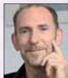
Andreas Winter www.andreaswinter.de