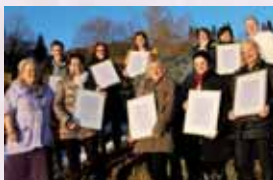
Absolventen mit ihren Diplom-Urkunden

Nach Abschluss des 4-moduligen Mentaltrainings haben Sie die Befähigung, die berufs begleitende Ausbildung zum/r Mentaltrainer/in zu absolvieren, wobei die vier Trainingsmodule angerechnet werden.