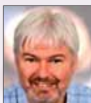
Jürgen Pfelfer www.activitum.com