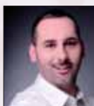
Christian Mörzt www.christianmoeritz.de