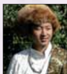
Chumba Lama www.wiu-wiu.com